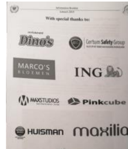
Uw logo in informatieboekjes.