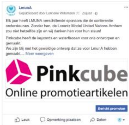
Uw logo en de link naar uw website op de Facebook van LmunA: LmunA | Arnhem | Facebook

Hieronder staan verschillende voorbeelden van naamsvermeldingen van sponsors van LmunA dit jaar en voorgaande jaren.